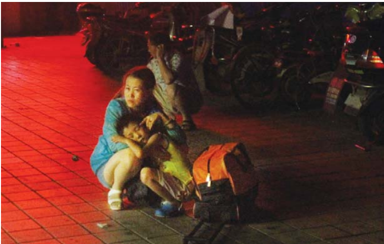
火车站外候车的母子。