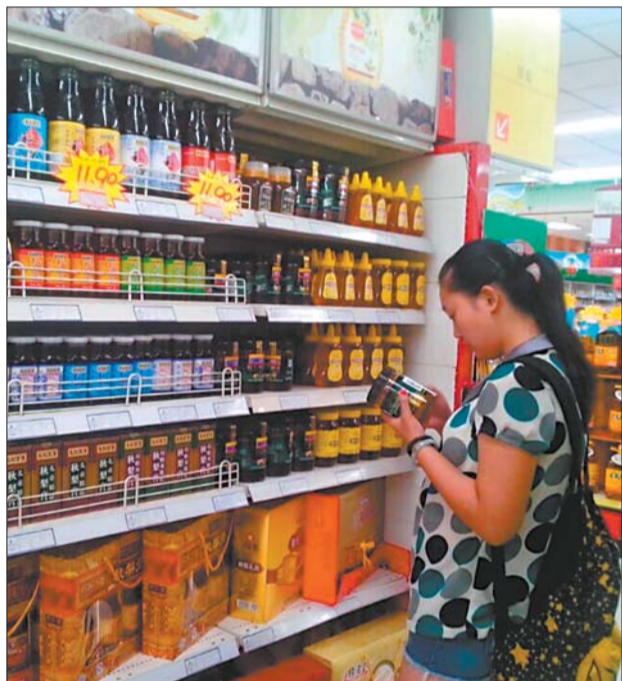
超市的蜂蜜专柜,选购的市民并不多。