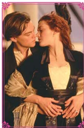
《泰坦尼克号》经典剧照