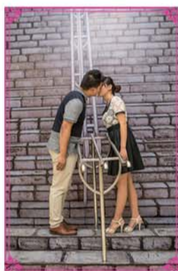
《我的名字叫金三顺》悦姐实拍