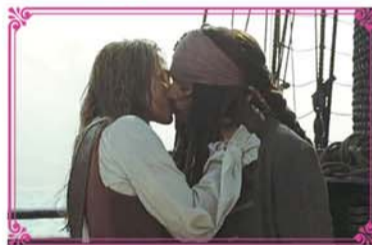
《加勒比海盜》经典剧照