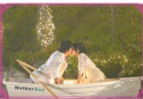
《天可怜见》经典剧照