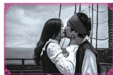
《加勒比海盜》悦姐实拍