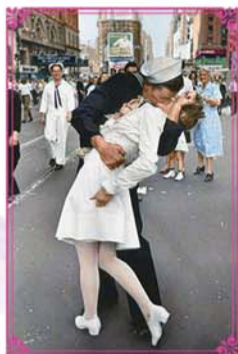
《胜利之吻》经典原照