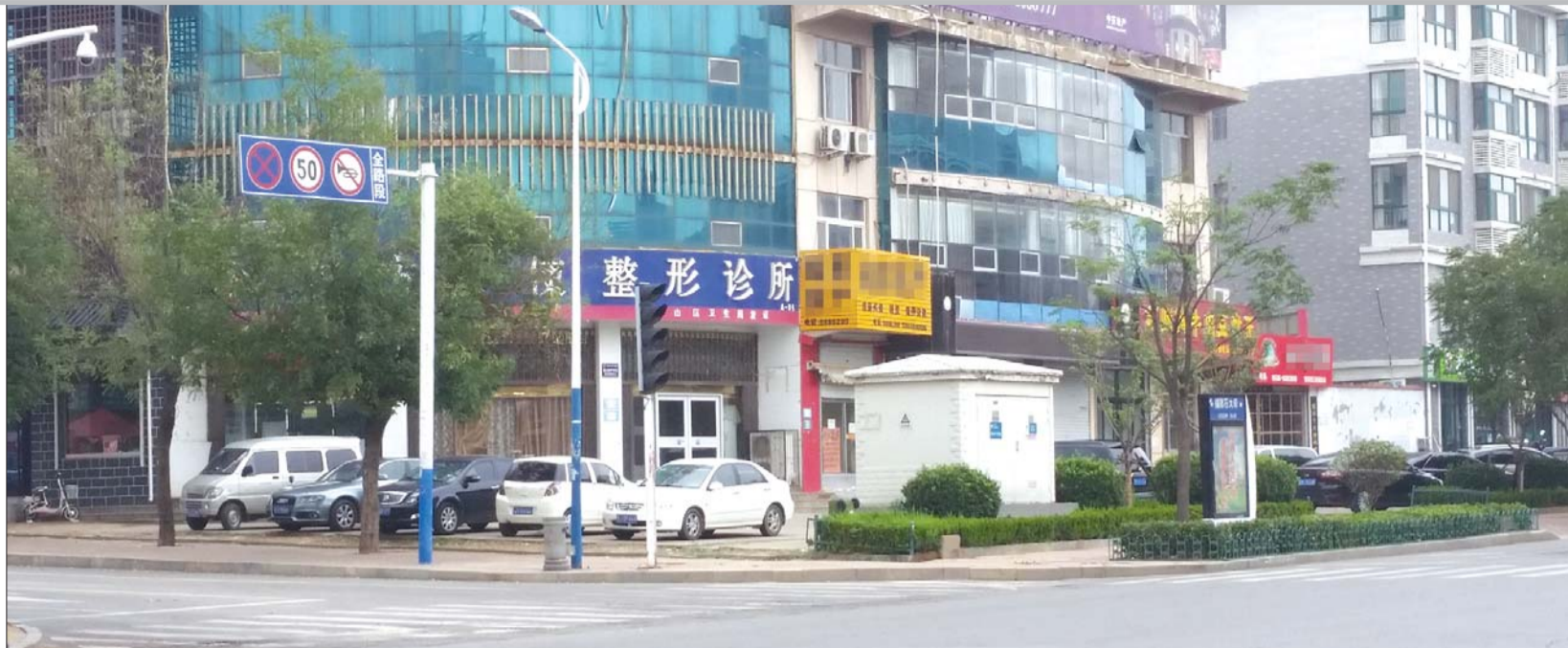
有的整形机构称,未成年人可以让其他家属代替签字,不用看身份证。