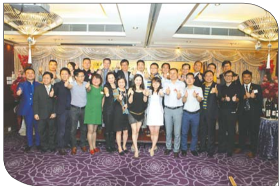
“发现中国葡萄酒”活动之香港站。

2014年5月26日晚，由酒媒主办，俊邦亚洲葡萄酒学院、酒媒网和香港葡萄酒评审协会承办的“发现中国葡萄酒”——中国佳酿出彩VINEXPO精品晚宴在香港鸿星酒店隆重举行。