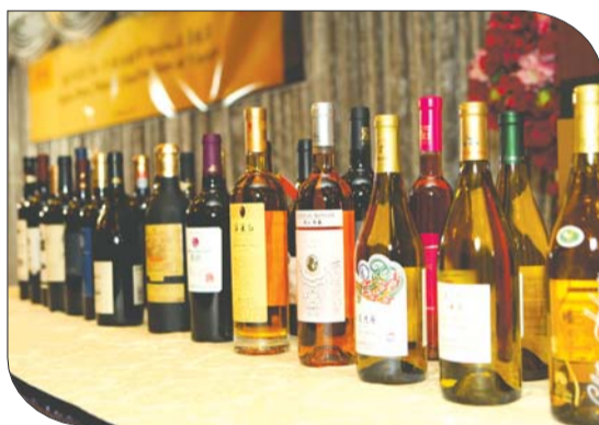
一场中国葡萄酒的盛宴。