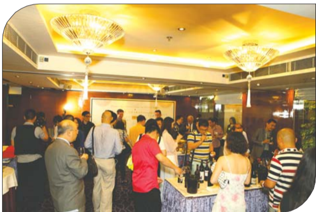
现场嘉宾云集，他们对于中国葡萄酒有着很多的期待。