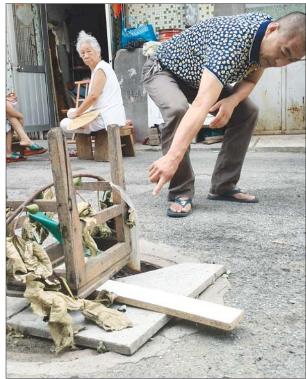
沼气超标的化粪池井盖坏了，居民在化粪池口盖上木板、石板，防止车辆经过，也防止有人乱扔烟头引起爆炸。

系了居委会和街道办，并告知邻居们尽量远离化粪池。 因为化粪池井盖多天前已经被轧碎，为了避免可能出现的安全隐患，管先生和邻居们在化粪池上盖上了石板和木板，最后放上了板凳等障碍物，并在两侧放上路障，防止车辆经过这里或在此停放。 记者看到，这个化粪池就在上乔西路137-5号楼前，位于路的中间，附近居民进出都要经过这段路。管先生说他每天和几个邻居轮流看着，防止有人往化粪池里扔烟头或者有小孩在此放鞭炮。 出于担心，楼上居民甚至给消防、市政、市长热线等打了电话，但是一直没问出究竟该由哪个单位来解决此事。