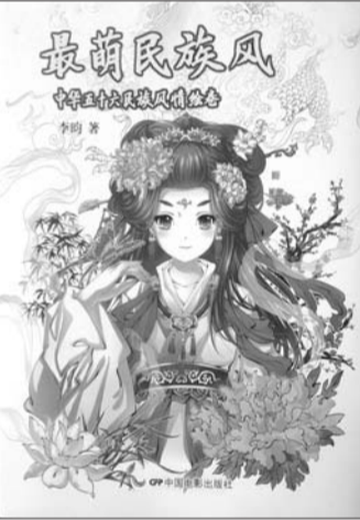
最萌民族风 作者:李昀 出版社:中国电影出版社