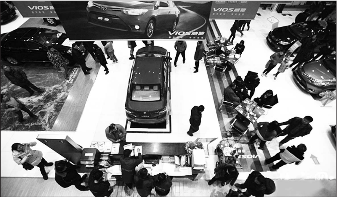
国家反垄断行为效果尚未传导到汽车销售终端市场,消费者得实惠还得等一等。(资料片)

即便如此,业内人士认为,国家执行的反垄断措施,还是会对相关汽车销售形成震慑作用,市场会得到一定程度的规范,长远看对整个行业的发展是有利的。