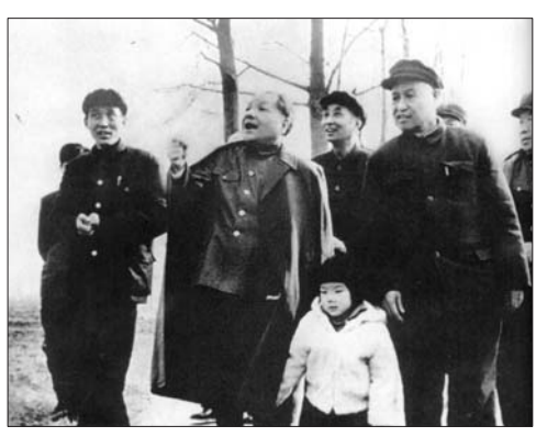
1983年2月27日,邓小平视察兖州林场。(资料片)