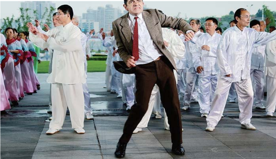
来自英国的“憨豆先生”罗温·艾金森和上海大妈们大跳广场舞,“倍儿爽”。

本报讯(见习记者 刘雨涵) “憨豆先生”罗温·艾金森于21日结束了首次中国内地行。短短3天的行程内,罗温·艾金森不仅在东方卫视《今晚80后脱口秀》中献出了自己的内地电视首秀,还为观众带来了一场精彩的“憨豆式”广场舞。据了解,他将极有可能参加东方卫视2015年春晚。 为表现“憨豆先生”丰富的肢体语言,《今晚80后脱口秀》节目组安排罗温·艾金森与中国大妈们进行了一次广场舞对决。面对身经百战的中国大妈们,他用“憨豆式”的舞姿征服