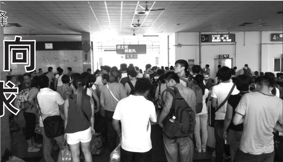
乘客正在排队等候检票上车。

京、青岛、烟台等高校比较集中的城市和旅游目的地。“预售期内这些方向的卧铺票基本售罄,硬座也较为紧张,乘客最好提前购买。”济宁火车站的售票人员周亚春介绍,8月中旬之后,学生返校高峰来临,济宁火车站每天发送旅客6000人次左右,这种状态将持续到8月底9月初,预计8月27日左右达到最高峰,发送客流量将达到7500人次。