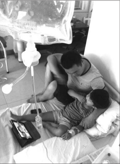
儿科是“逢病皆吊瓶”的重灾区。本报记者 李倩 摄

象,让很多孩子免疫力下降,对阿莫西林、头孢类药物产生耐药性,不得不提高剂量才能见效,肌肉注射已无法达到应有的效果。”济宁市第一人民医院儿科专家介绍,细菌引发的炎症用抗生素才有用,而像感冒、腮腺炎等都是由病毒引起,抗生素起不到效果。“单纯的上呼吸道感染,发热低于38℃,孩子精神状态也不错,就不需要使用抗生素。” “医院对于抗菌药物的使用有严格规范,需要有细菌及病原微生物感染的临床诊断才能使用。”济宁市第一人民医院药理学部主任程立介绍,临床用药遵循“能口服不肌注,能肌注不输液”的原则,门诊患者的处方中,输液病例仅占两成左右。 “作为侵入性给药方式,静脉输液有一定的危害性,安徽卫生部门发布的这份名单,为患者就诊提供了参考,引导市民做到不主动要求使用抗生素,遇到滥用抗生素的情况也可以监督投诉。”临床