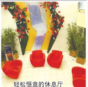
轻松惬意的休息厅