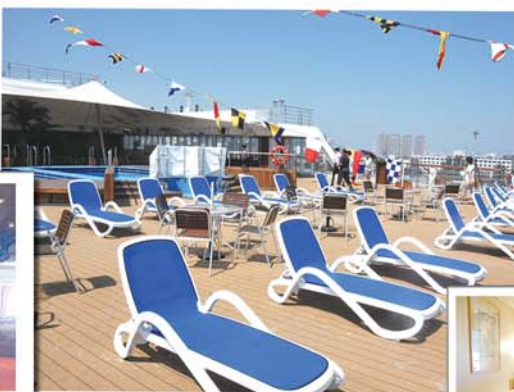
▲甲板上可静享日光浴