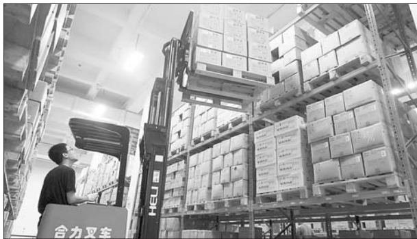
华润物流中心内景。

华润山东医药下设多家子公司,经营网络很完善,药品可配送覆盖全省17个地市150多个县区。2013年公司实现销售收入90亿元,连续多年保持全省医药商业企业首位。