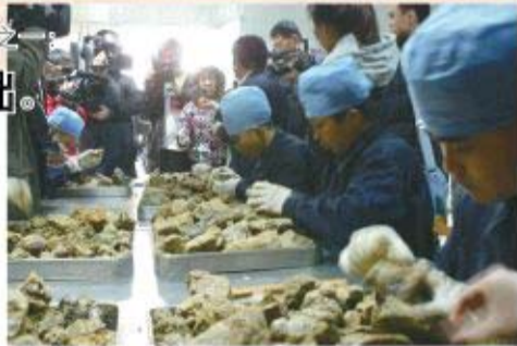
媒体、监管领导参观选胶车间

从1999年成立之初,知蜂堂就将蜂胶原料储备作为企业发展的根基。知蜂堂蜂胶原料储存库,-5℃恒温储存,可以保证原料不变质,用户可以