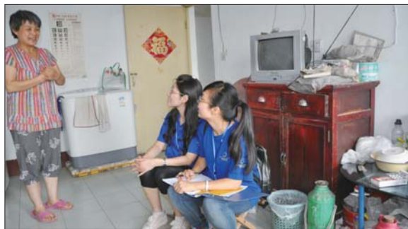
公益组织工作人员到韩韩家了解情况。

我们期待爱心人士伸出援助之手,帮帮这个不幸的家庭。应社会各界要求,本报即日起开通捐助热线:18678147110。