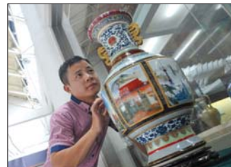
一位市民正在欣赏参展作品《盛世中华瓷王》。

本次展览的组织者表示,景德镇代表着中国艺术陶瓷的深厚积淀,淄博陶艺享有“当代国瓷”美誉,两个陶瓷产区间的文化交流非常有意义。展览将持续展出到10日,诚邀热爱陶瓷艺术的收藏家和艺术爱好者们观看、指导,并为广大家长孩子与大师精品“零距离”接触提供绿色通道。