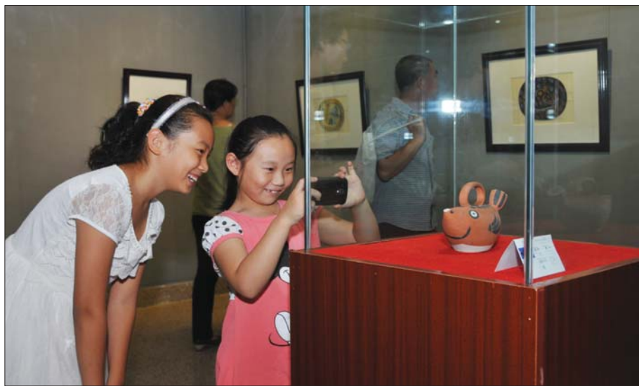
毕加索的作品吸引小朋友前来拍照。

谈及陶艺展的深层意义,市委经信工委书记、市经信委主任魏玉蛟说,此次展出必将极大的丰富淄博市乃至全省人民的文化艺术生活,激励和启发文化和陶瓷艺术创作者,提高水平,创作出更多更好的陶