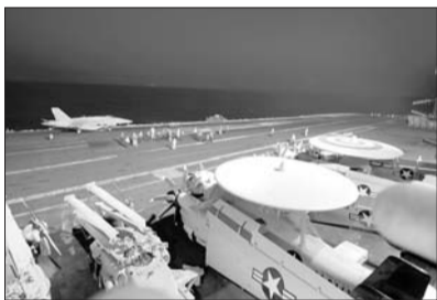
▲“乔治·布什”号航空母舰上,美军大黄蜂舰载型战斗机准备从甲板上起飞。