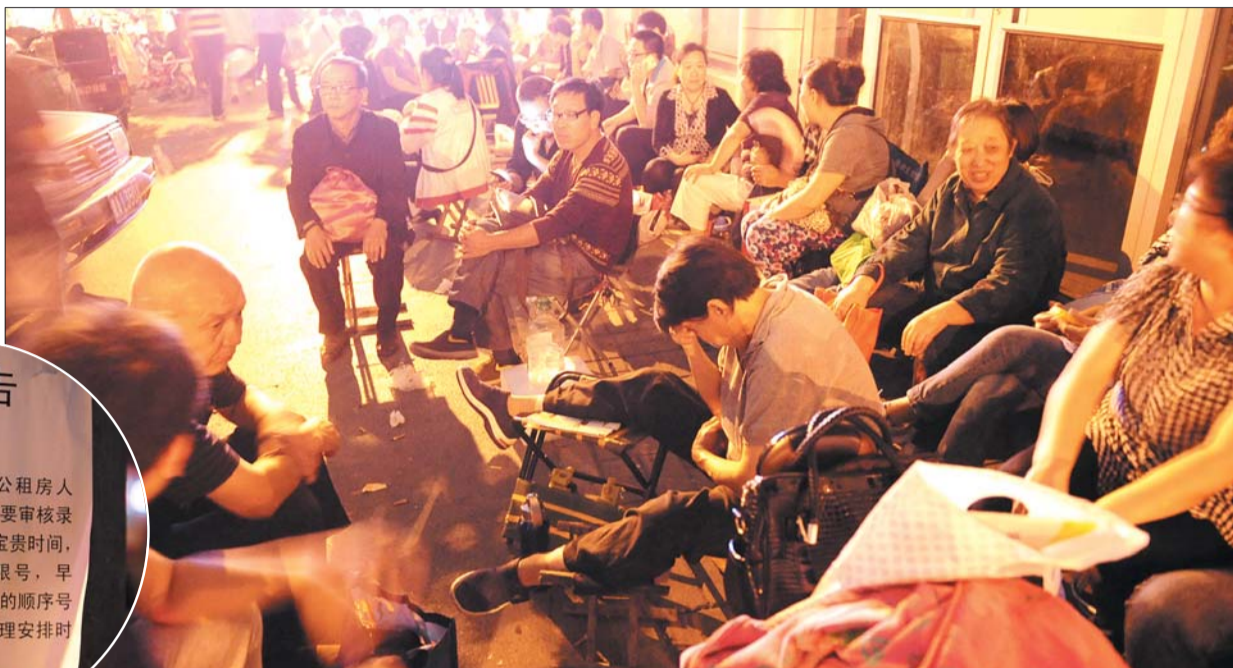
22日夜,历下区房管局门口,市民在夜色中排队领取报名序号。