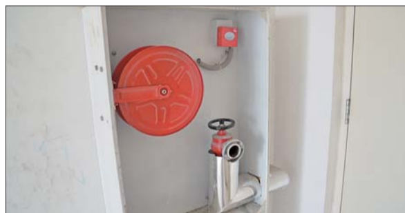
火灾发生时,消防栓内没有水。

消防部门的负责人介绍,目前高层住宅小区须按规定配备消防栓,目的是在高压水枪无法进行灭火时,居民可进行自救。而消防栓总阀门是整个消防设施的一部分,属于监管