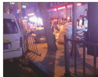
护栏被卸下来扔在一边。

本报9月23日讯(见习记者 郑帅 王建华) 连日来,有市民向本报反映,历城区洪家楼夜市的摊主把路边的防护栏都拆了。记者来到花园路洪家楼附近夜市看到,路边的防护栏很多遭到拆卸,摊主的车辆和货物都放在了马路上。