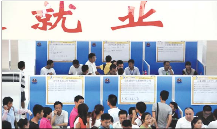
招聘会吸引众多大学生, 选择创业的很少。(资料图)

济宁市第二届创业大赛决赛将于28日开启, 全市共百余人报名参加此次大赛, 其中不乏“90后”面孔。然而, 报名者中在校大学生较少。为鼓励更多大学生创业, 济宁市下发通知, 通过提高创业补贴、小额担保贷款额度等, 帮助有创意意愿的大学生或毕业生们解决资金这一最大“拦路虎”。