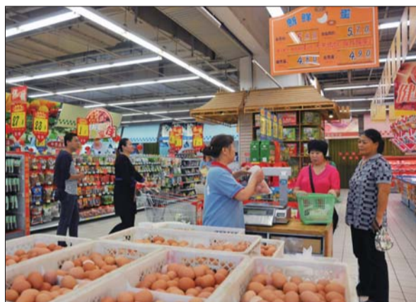
市民在张店柳泉路一超市购买鸡蛋。

芹菜、黄瓜、大白菜、茄子、西红柿的价格出现略微上涨,其中茄子上涨幅度较大,从上个月的平均价格0.96元/500g元上涨到现在的1.23元/500g。据介绍,受换季影响,一些夏季蔬菜产量减少,价格随之上升,随着天气逐渐降温,市民消费会逐渐转向大棚蔬菜,蔬菜价格还会有上涨的空间。