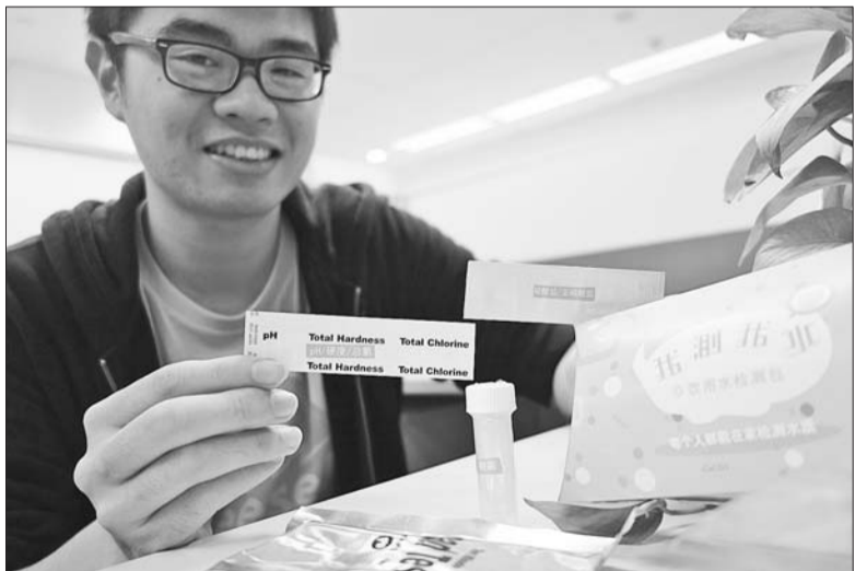
标准版水质检测包可检测七个项目。

本报济南9月26日讯(记者 肖龙凤) 作为“步行齐鲁·家乡的河”大型公益活动的组成部分, 本报联合阿里公益天天正能量, 在27日的本报读者节上开展“我测我水”饮用水检测活动, 张刚大篷车还将送上首批180个“我测我水”水质检测包。居民只要现场扫码关注齐鲁晚报张刚大篷车官方微信, 并向工作人员出示, 就可以领取一个水质检测包, 了解家中饮用水的水质。数量有限, 先到先得, 快来领取吧!