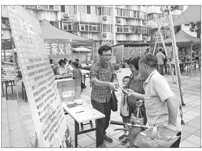
市民领取水质检测包。

如果您家中的自来水有奇怪的味道或颜色,或家人多次发生肠道疾病,或家中有免疫力相对低下的老人和幼儿,或使用老旧的供水管道并且观察到有腐蚀的痕迹,或烧水后水垢很多,有以上几种状况时就应该定期对饮用水检测。