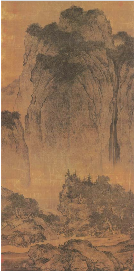
溪山行旅图·北宋·范宽

中“情意”所失也是一大现状,当代很多山水画家没有“读万卷书,行万里路”的经验积累,缺乏先人“林泉高致”的山水精神与审美情怀,外出写生时面对多样的景色总是画的“千篇一律”,躲在电脑背后看风景图片,在画面图式的“符号化”和“卖相”上下功夫。那么,如何对自然中行、色、光、线的各种体验,培养自己对景的敏感性、性情;如何通过笔墨媒材的物化来表现内在生活的感受;如何通过深入体会风景,将生活之景转化成心中的之境、画中之趣?我想首先还是要到自然中“畅神”吧! (贾佳)