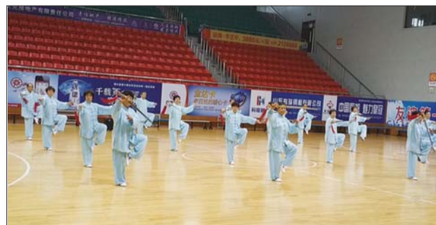
以柔克刚的太极剑表演。

本报9月28日讯(记者 孙菲 见习记者 李芳 通讯员 李晓艳) 26日,“中国体育彩票杯”2014年博兴县“庆国庆·迎重阳”老年健身活动展演在博兴体育馆隆重举行。