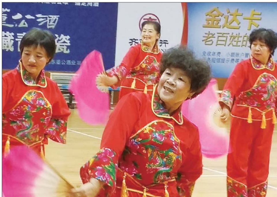
喜气洋洋的扇子舞。