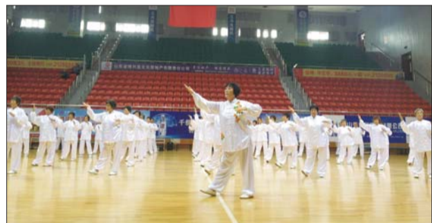
开合有序的太极拳。

县委常委、组织部部长郑令健在致辞中讲到,全社会要大力弘扬中华民族尊老、爱老、敬老的优良传统,多为老年人办实事、办好事,切实帮助他们解决生活中的困难和问题,让广大老年人老有所养、老有所为,真正在全社会形成尊老敬老的良好社会风尚,希望参加本次活动的老年人充分发挥示范带头作用,带动更多老年朋友参加到体育活动中来。