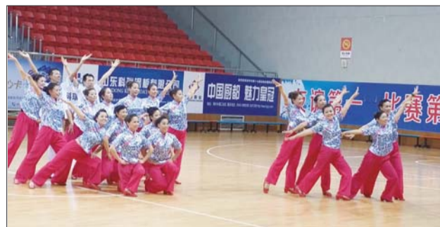
热闹的老年广场舞。