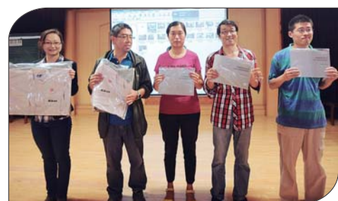
从当日拍摄作品中评出了2幅佳作奖和3幅优秀奖,获奖居民上台领奖。