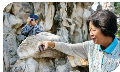
单反、卡片微单、手机齐上阵。