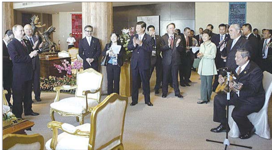
2013年10月7日,普京在印尼APEC峰会上度过了自己61岁生日,印尼总统苏西洛亲自弹着吉他为普京唱生日歌,中国国家主席习近平向普京赠送了生日蛋糕。(资料片)

当被问及普京今年生日为何罕见休假时,佩斯科夫回答说,总统最近几年生日都安排了各种活动,而今年总统的工作日程非常紧张,有时甚至几乎全天工作或安排长途飞行。公开资料显示,普京没有在生日这天专门休过假,而是参加各种会议、活动和视察等。