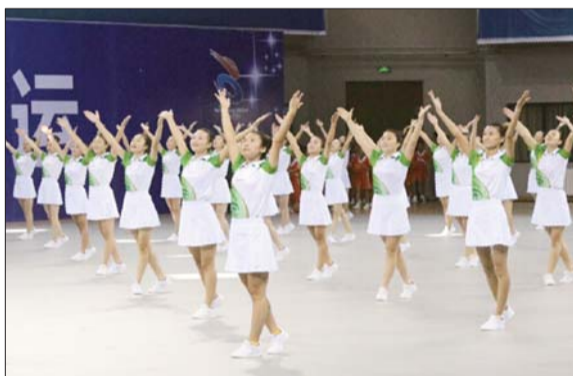
志愿者们表演团体节目。

省第九届残运会将持续到10月16日,历时8天。本届省残运会共设18个大项、23个分项、777个小项、788枚金牌。全省17个市和山东省特殊教育中等专业学校组团参加,参赛运动员1806名。