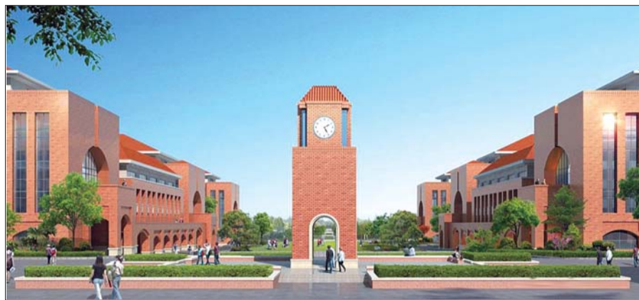
山大青岛校区学生公寓效果图。据悉,公寓建成后,本科生将安排4人一间。