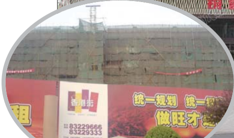
◀章丘中心商贸区(旧)。

“十一”假期刚过,不少游客深切感受到章丘市多年来的变化。景更美了,路更宽了,成为众多游客口中常说的一句话。四大片区的规划、不少旅游景点的翻修改造以及城镇建设的提升成为章丘这几年来最大的改变。