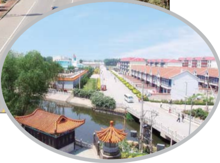
▶章丘小城镇建设(旧)。