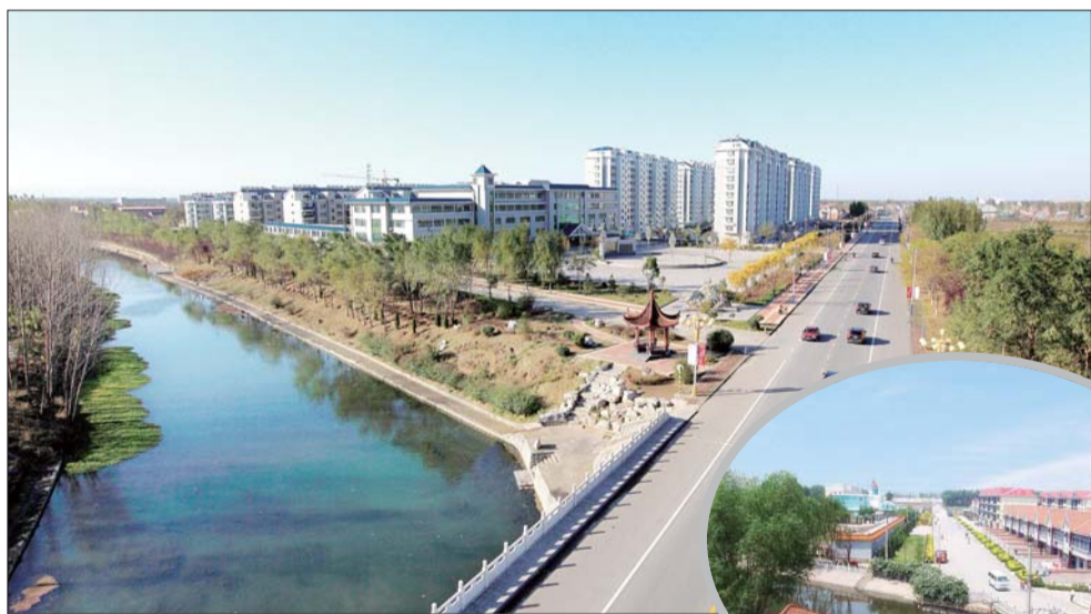
▲章丘小城镇建设(新)。