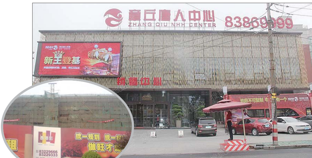
▲章丘中心商贸区(新)。