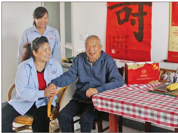
黄金出租星级车队员与老人聊天。

此外,重阳节当天,70岁老人(持有效证件)搭乘黄金出租公司车牌前带有星级车队标识的出租车还享受了免费乘车服务。50名星级队员表示将用实际行动庆祝重阳节,为老人提供最贴心、最优质的服务。