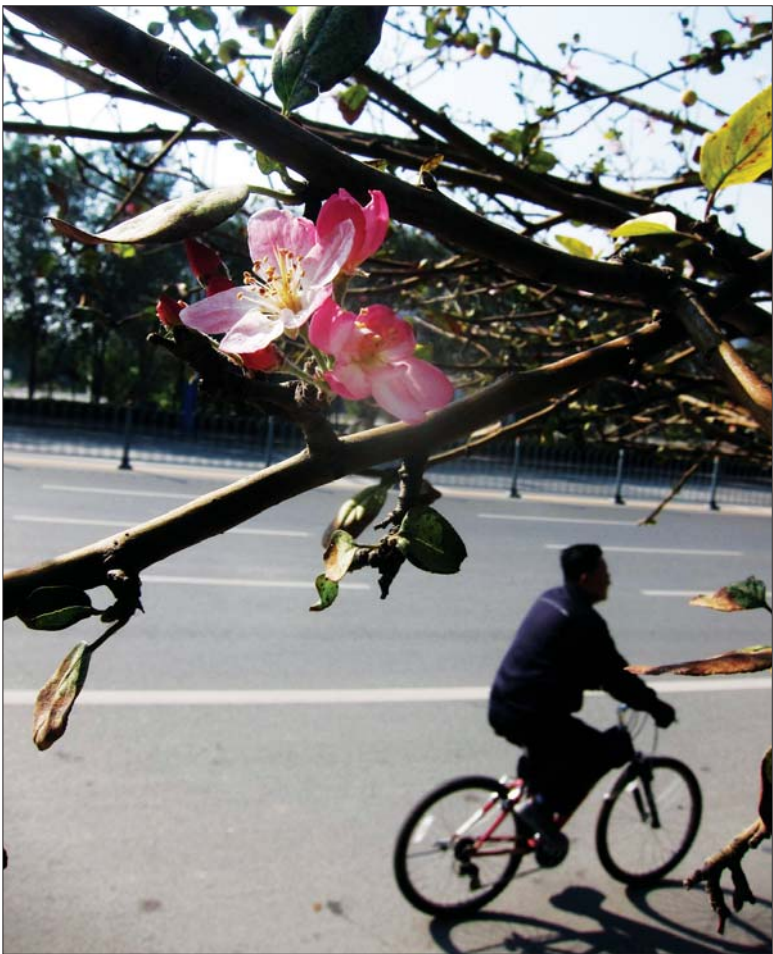
二度花开 10月14日,在天衢路上,本应在四、五月份开花的海棠树再度开花,零星的小花与果实同时挂在枝头。

本报10月14日讯(记者 李榕) 日前,德州发布《德州市四大行业用工现状及问题调研》,制造业、建筑业、批发和零售业、住宿和餐饮业等用工较多的四大行业门类依然存在“招工难”现象,在调查企业中,认为“企业最需缺人员是普通技工”的占调查企业的38%,而求职者对薪酬期望过高是造成企业“招工难”的主要原因。 本次德州市重点调查的255家企业中,涉及用工较多的四大行业门类,其中制造业65家、建筑业65家、批发和零售业65家、住宿和餐饮业60家。 “根据企业发展需要,本企业最需缺的人员中,普通技工是企业最需缺人员。”在255家被调查企业中,认为“企业最需缺人员是普通技工”的占调查企业的38%,需缺高级技工和经营管理人员的分别占20%和18%,科研人员需缺的占10%。半数以上的被调查企业认为有“招工难”问题。 记者了解到,之所以用工出现缺口,有25%的企业认为符合岗位需求的应聘者明显减少;有45%的企业认为求职者对薪酬要求过高,特别是高校毕业生,对2000元以下薪酬岗位无人问津;另外,有30%的企业认为求职者明显减少,招聘渠道不畅,人才市场供不应求。 此外,职工薪酬上涨给企业带了很大压力。企业所招的普通技工的月底薪上涨明显,在受调查的255家企业中,与去年同期相比,近六成的企业提高了薪酬待遇,月薪下降的仅占3.2%。 “从被调查企业看,企业用工流失率偏高、用工成本持续攀升、部分企业存在招工难等问题都不同程度存在。”相关专家表示,缓解企业用工难问题是一个系统工程,需要政府、学校、企业、社会共同努力,并提出制定民工基本就业技能培训规划和实施方案,使技工学历教育更多的转变为民工实用技能短期培训;企业可适度提高员工工资和福利待遇;政府可适时制定相关优惠政策,给经营压力较大的企业以扶持;完善劳动力市场公共服务体系,解决就业结构矛盾等。