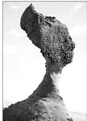
野柳地质公园“女王头”

目前入台配额比较紧张,想参团的读者要提前报名。您还在等什么?错过这一次特价的机会就再也没有了!报名电话2295668、2295669、2350110。