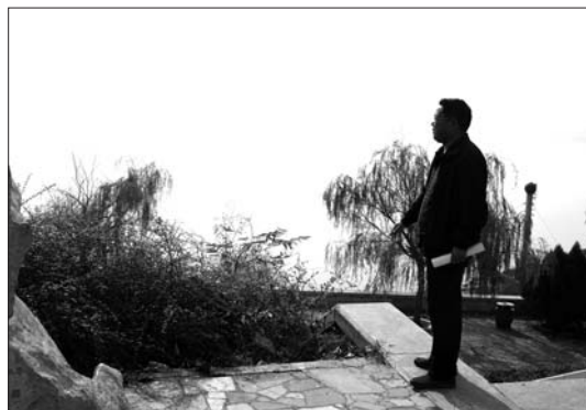
◀ 站在湖畔，可以欣赏尼山美景。

如今，在孔子湖湿地公园，白鹭、池鹭、白鹅与葱绿的芦苇荡相映成趣的风景画，让人流连忘返。