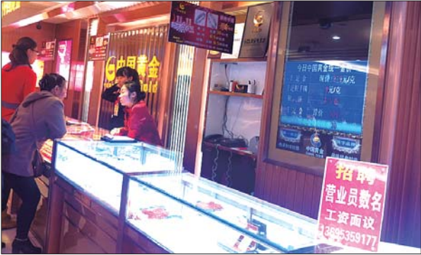
近期黄金价格出现下跌,千足金每克下降30元。

回顾上周国际金价报收1170.7美元/盎司,下跌0.4%。黄金周五暴涨3.15%,触及一周高位1178.64美元/盎司。主要原因一方面弱于预期的非农数据提振了市场情绪,另一方面被长期压力的多头情绪被放大,10月下旬以来黄金已经下跌了超100美元。