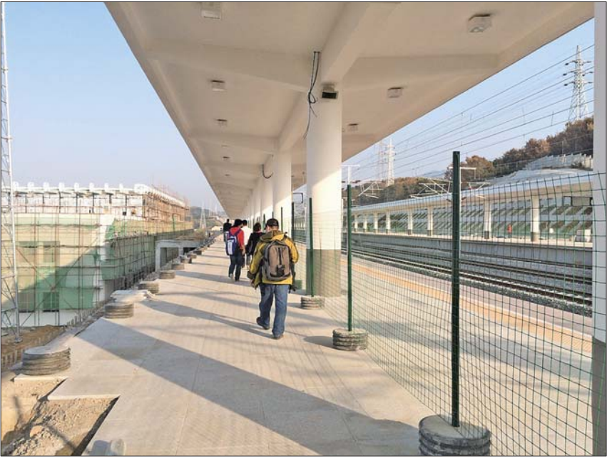
威海北站站台一角。

次公交车同时上下客。二层通过中间的集散换乘厅划分成两个部分,东侧为社会车停车场,西侧为出租车停车场,分别设有社会车停车位112个和出租车蓄车位42个,东西两侧各有一个坡道直接与