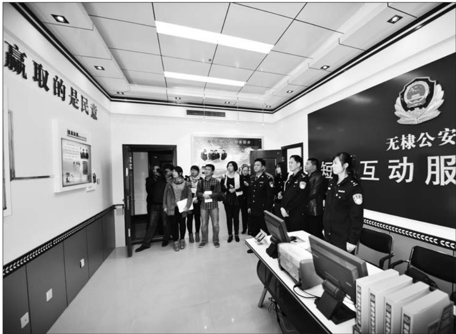
媒体团参观无棣公安。

的自行车、电动车被盗等小案件、小问题,坚持“抓大不放小、小案不小看”,严格落实现场必勘工作机制,落实破案责任和破案期限。今年以来,一般案件、特别是小额侵财案件破案率同比提高了25%。