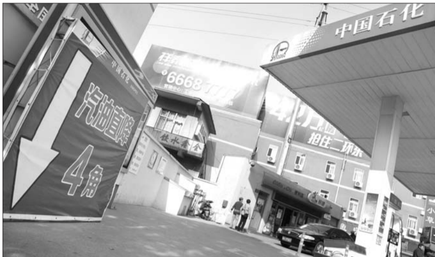
14日,在济南山大南路一家加油站前,打出了“汽油直降4角”的牌子。

航空公司也是此轮油价调整的受益者。11月4日,海航、厦航、吉祥等航空公司发布公告称,自本月5日起,800公里(含)以下及800公里以上航段,国内航线燃油附加费分别下调10元及40元。如此一来,消费者乘机费用降低,航空公司燃料综合采购成本同时下降,这对于目前景气程度较差的航空行业经营状况是一个良性支撑。