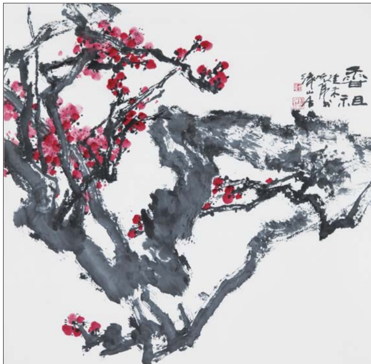
▲春 88x68cm 沈光伟