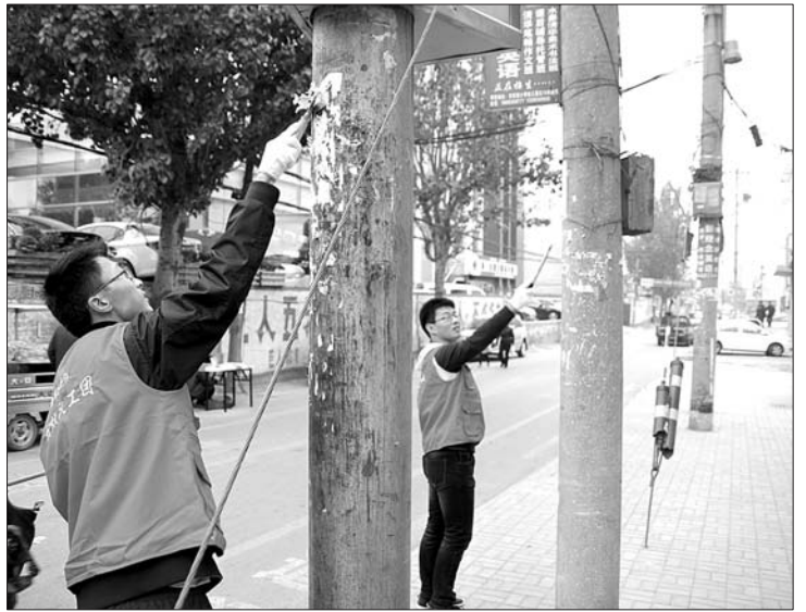
本报蚂蚁义工走上街头,清理小广告。

清理小广告正式开始。义工们发现小广告先用喷壶将其喷湿,然后再用铲子将其铲掉,整个过程大约持续30秒时间,“张贴一张小广告也就1秒的时间,而清理干净却需要30秒,不少小广告贴在人行道上,清理时还需要蹲下清理。还有一些小广告为了防止被撕掉,故意贴到隐蔽的角落,也增加了清理难度。小广告不仅影响市容,还污染环境,希望这种不文明现象能得以制止。”刘寒英说。