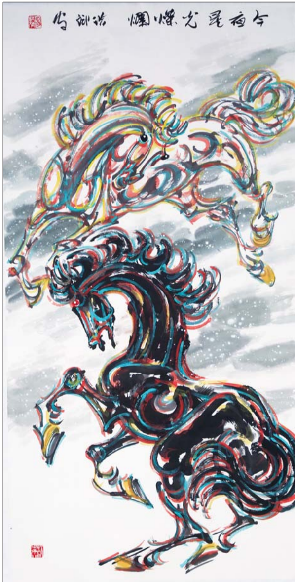
▲今夜星光灿烂 易洪斌

李宝堂,1952年生,山东嘉祥人。中国美术家协会理事,甘肃省美术家协会主席,国家一级美术师,曾任甘肃日报社社长,享受国务院政府特殊津贴。