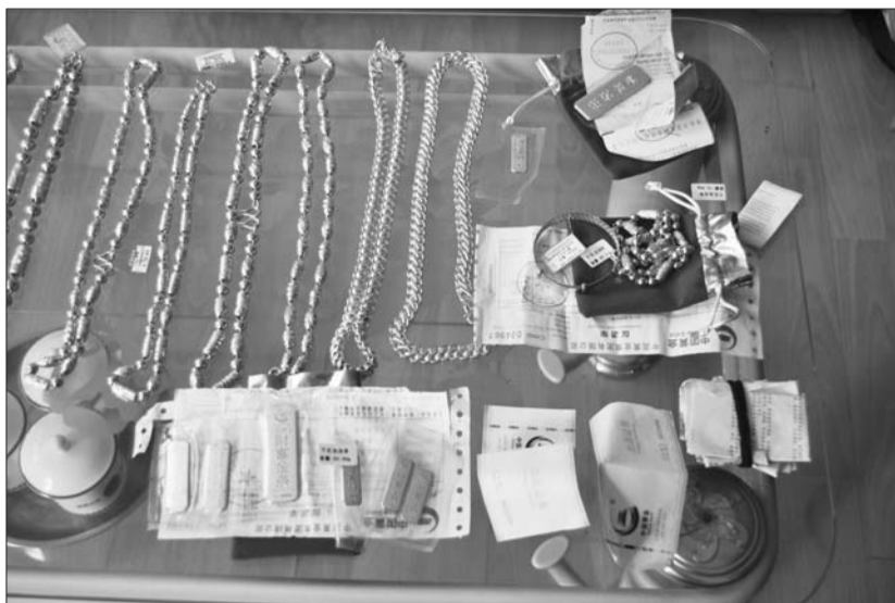
嫌疑人狂买了大量黄金饰品。