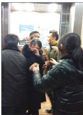
女子得救后哭着走出电梯门。

本报泰安11月23日讯(记者 张伟) 21日下午5点40分左右,岱岳区东岳书香苑小区3号楼,一名女子被困在电梯二楼与三楼之间,近1小时。消防官兵赶到后,与电梯维保工作人员一起,将女子救出。