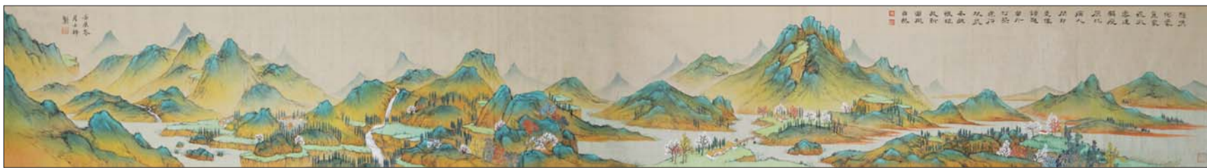
▲临水有深意望山多远情 35x260cm