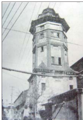
▲老水塔老照片 ▲装修一新的通和塔。

走进老水塔，里面干净整洁，几根碗口粗的铸铁水管直通塔顶，西侧是一个木制楼梯盘旋而上，因年代久远，走在上面咯吱作响，仿佛百年历