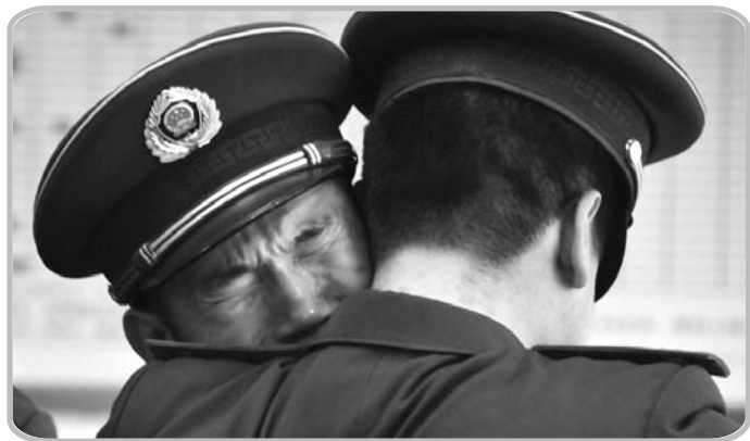
两位老战友相拥而泣。