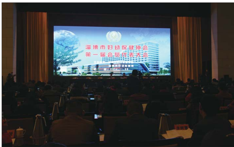
26日,淄博市妇幼保健协会正式成立并举行第一届会员代表大会。

中国妇幼保健协会会长、原国家卫生部副部长张文康表示,淄博在山东省率先成立市级妇幼保健协会,成立基础好,起点高,将来一定成为全国市级妇幼保健协会的佼佼者。据省卫生和计生委副主任杨心胜介绍,淄博市妇幼卫生系统坚持妇幼卫生工作方针,贯彻落实“一法两纲两规划”,积极应对单独两孩政策实施对妇幼健康服务的新挑战,结合全省“妇幼健康服务年”活动要求,加强出生缺陷综合防治工作,2014年,淄博市在全省率先实施新生儿疾病免费筛查,筛查率达99.64%,产前筛查率由2013年的46.29%上升至85.16%。通过实施淄博市农村妇女“两癌”免费检查全覆盖,年度11万农村妇女受益。市妇幼保健院“试管婴儿”技术通过专家组评审,标志着淄博市生殖医学技术迈上一个新台阶。