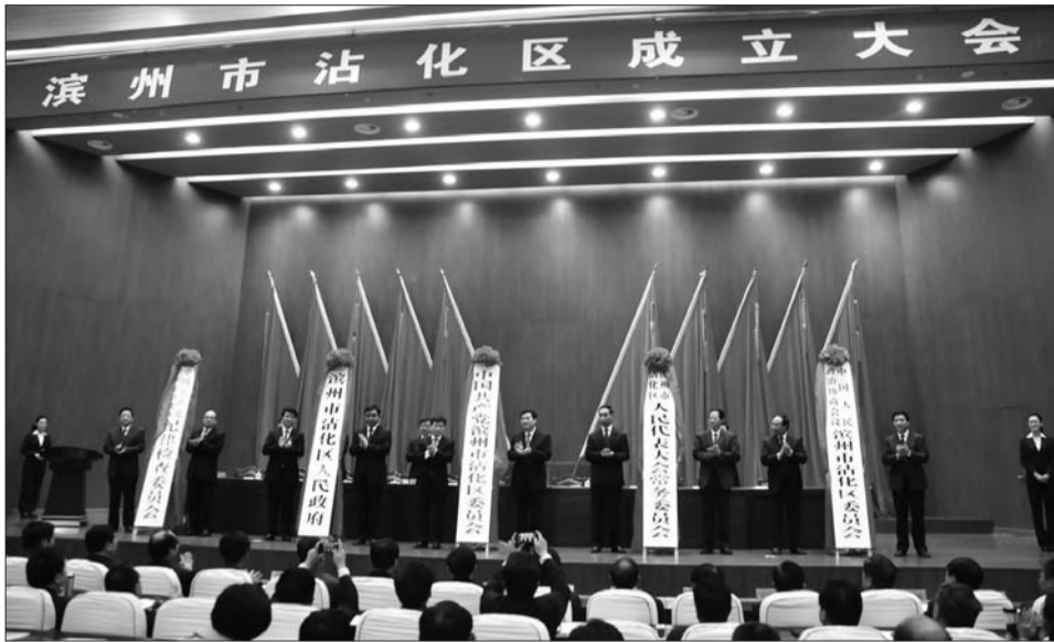
滨州市沾化区成立大会揭牌仪式。

张光峰指出,现在到年底还有一个多月的时间,是全市各项工作“收官”的关键时期、“冲刺”的关键阶段。全市各级各部门要立足于圆满完成目标,致力于超额完成任务,对照年初既定计划,全面盘点审视今年以来的工作。同时,要进一步强化大局意识、责任意识,主动为沾化撤县设区做好服务工作,积极融入沾化区开发建设,推动中心城区与沾化区融合发展、联动发展、一体发展,努力打造全市经济社会发展新的增长极。