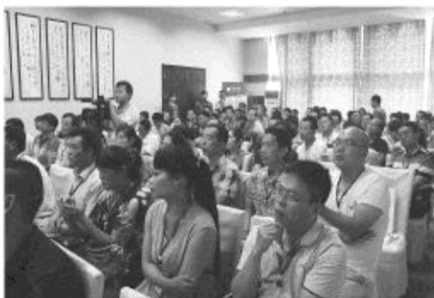
●e通全盐城招商会现场

以前,电信行业由国家垄断经营,每年超过万亿的巨额财富被三大通讯巨头独享。如今,民营企业进军电信