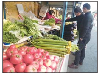
进入冬季, 菜价涨幅明显。

济宁市农委市场信息科工作人员表示, 进入12月份, 随着气温的逐渐下降到0度以下, 蔬菜市场批发价格特别是叶菜类蔬菜价格将会继续保持缓慢上涨态势。